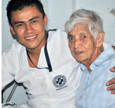
Archimède: formation de soignant grâce à une bourse