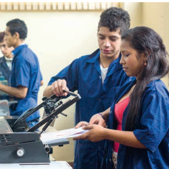
à l'imprimerie de la Ciudad Don Bosco

A Medellín, dans la seconde plus grande ville de Colombie, les Salésiens de Don Bosco aident également d'anciens enfants soldats à se réinsérer dans la société. Dans la Ciudad Don Bosco , ils soutiennent chaque année 60 jeunes traumatisés par le biais d'un programme spécialement adapté à leurs besoins.