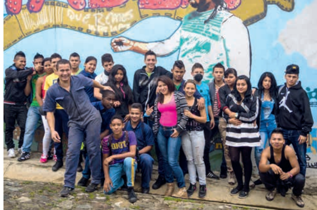
Contacts sociaux et cohésion font partie du système préventif Don Bosco