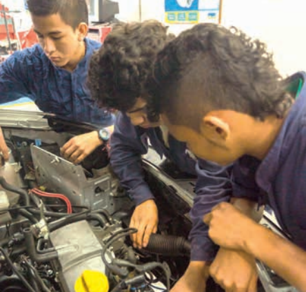
Cours de mécanique auto au centre de formation professionnelle