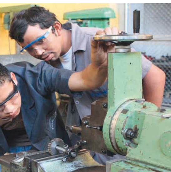
Les jeunes apprennent à manier un tour et une fraiseuse

260 jeunes hommes et femmes entre 15 et 24 ans suivent des cours au centre de formation professionnelle Don Bosco à Guatemala City. Ils font partie de la classe sociale la plus pauvre du pays. Le niveau moyen de formation s'élève à trois ans d'école primaire. Outre des cours professionnels composés d'un volet théorique et pratique, les apprentis peuvent également rattraper leur certificat de fin de scolarité, afin de combler cette énorme lacune de formation. A cela s'ajoute le développement global de leur personnalité, de leur confiance en soi et de leur conscience professionnelle. Les instructeurs les aident à surmonter les expériences négatives du