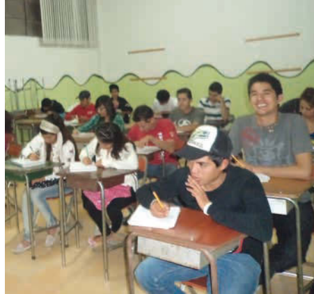
Des cours gratuits aident à terminer la scolarité