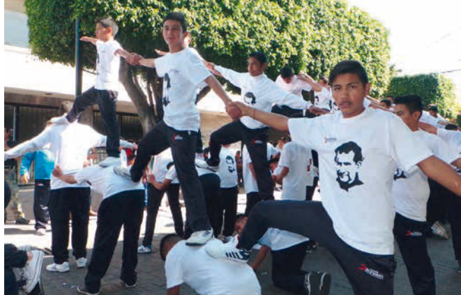
Diverses activités de loisirs éloignent les jeunes des bandes criminelles