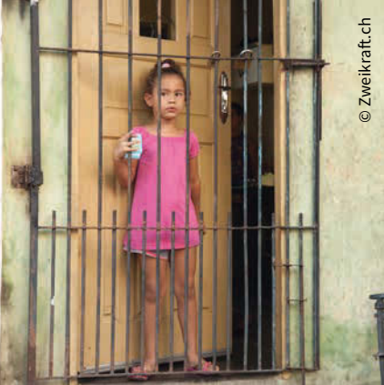
Des barreaux aux portes doivent offrir une protection