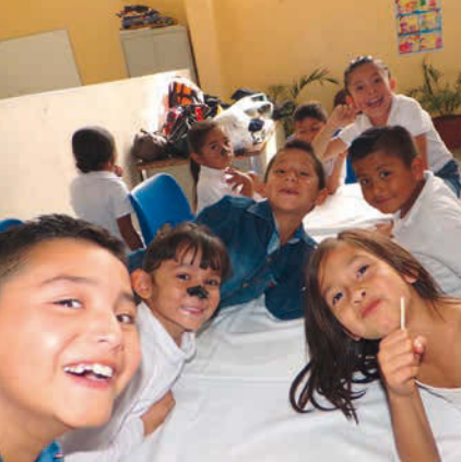
Le travail de prévention commence chez les plus petits