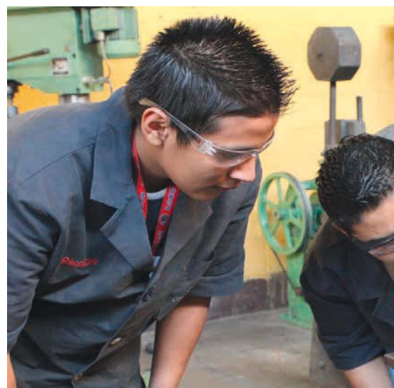
Dans les cours professionnels Don Bosco à Guatemala City, les jeunes

Autodétermination et responsabilisation grâce à la formation professionnelle Don Bosco