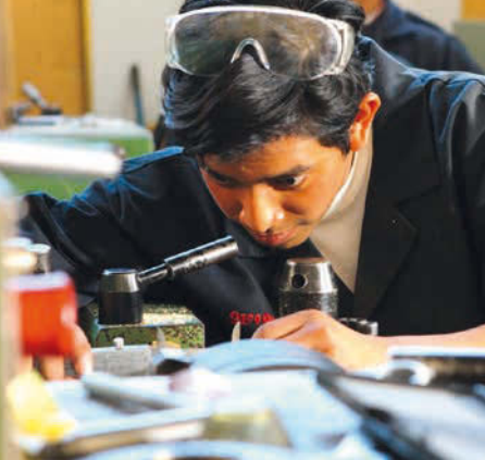
Les jeunes apprennent à s'appliquer et à travailler avec précision