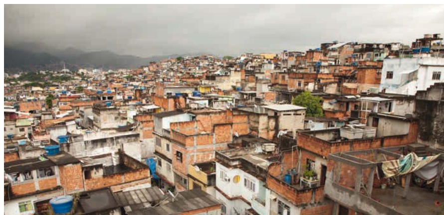
Dans les bidonvilles des villes sud-américaines, des bandes criminelles règnent souvent avec brutalité.

La violence est le fruit de la pauvreté et de l'exclusion