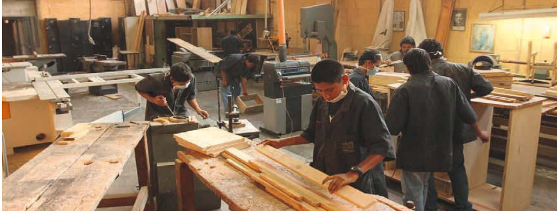
A l'atelier de menuiserie, les élèves acquièrent la pratique nécessaire pour un futur emploi chez un fabricant de meubles